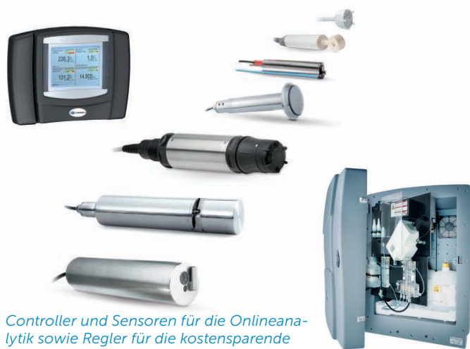
Controller und Sensoren für die Onlineanalytik sowie Regler für die kostensparende Prozessoptimierung