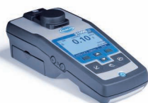
Benchtop- und tragbare Geräte für die Laboranalyse Instandhaltung und Gerätequalifizierungsdienste verfügbar