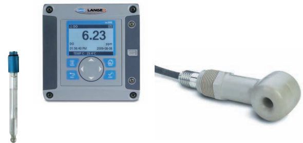
Controller und Sensoren für die Onlineanalytik sowie Regler für die kostensparende Prozessoptimierung.