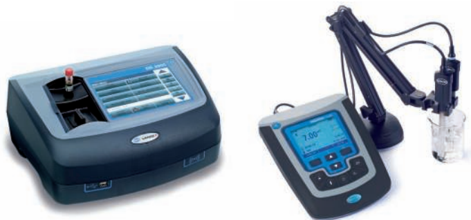
Labor- und tragbare Geräte für die Laboranalyse, mit speziellen Tests für Galvanikbäder. Instandhaltung und Gerätequalifizierungsdienste verfügbar.

* Für weitere Parameter und Lösungen kontaktieren Sie bitte Ihren HACH LANGE Vertreter vor Ort oder besuchen unsere Website.