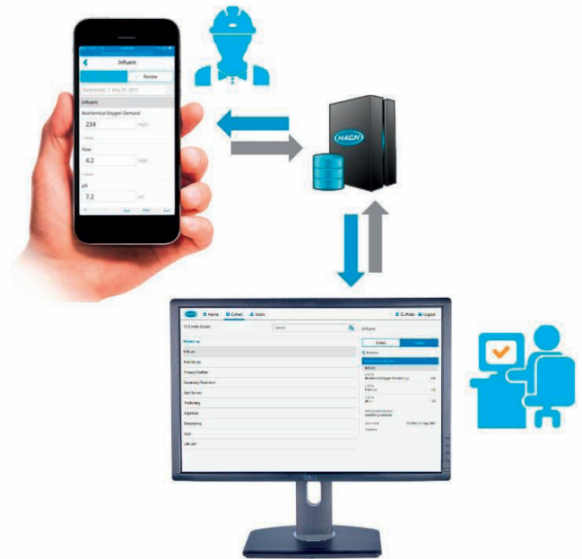
Abbildung 4: Exakte Felddatenerfassung, verfügbar für berechtigte Benutzer, zu jeder Zeit, an jedem Ort und über jedes Gerät.

Wir unterstützen die aktuelle und vorherige Version der Browser Google Chrome, Safari® und Microsoft® Edge.