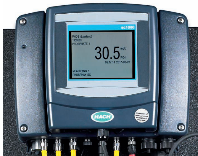
Figure 4 : Exemple de données en temps réel affichées sur le Phosphax