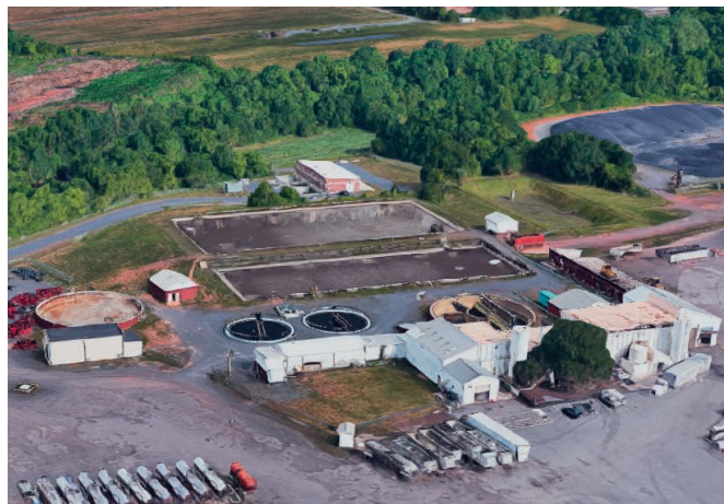
Figure 1 : La station de traitement des eaux usées de JBS rejette les eaux directement dans la rivière Skippack Creek, qui se jette ensuite dans le fleuve Delaware.

Avec Prognosis, un système de diagnostic prédictif au sein même de l'analyseur Phosphax, Hach est également averti de tout problème d'instrument imminent affiché sur le transmetteur SC1000 et peut ainsi assurer une maintenance proactive. Ainsi, les opérateurs de la station de traitement des eaux usées savent avec certitude si les variations de mesure sont dues à des changements dans leurs instruments ou à l'eau elle-même.